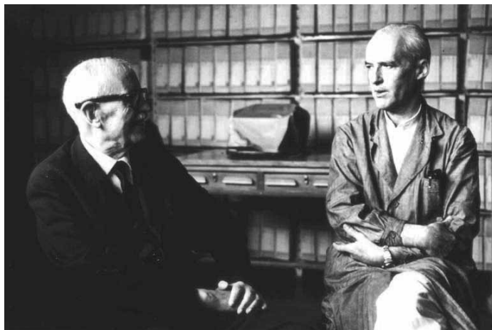
Ilustración 1: Houssay y Leloir.

Los análisis realizados indican que en la educación secundaria y universitaria, algunos profesores cumplen un papel destacado en la orientación ante decisiones importantes y la inclusión de los jóvenes en ámbitos especializados. La contribución principal de los docentes se vincula con la presentación de los jóvenes a otros miembros de los ámbitos especializados, la orientación respecto de temas de investigación y lugares de